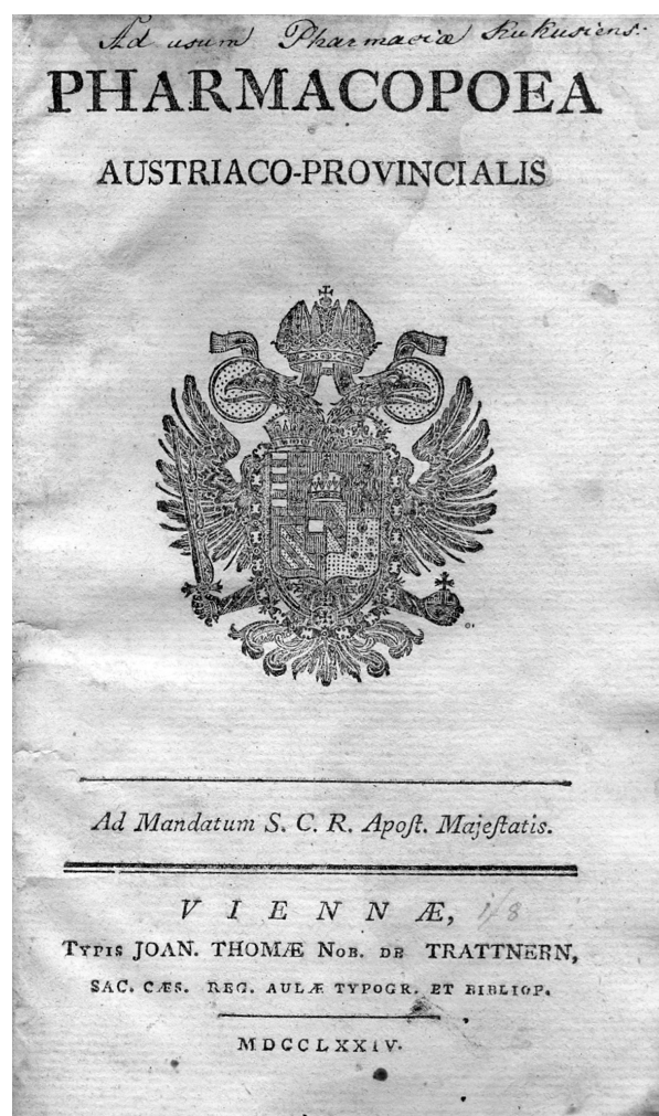
Obr. 1. Titulní list lékopisu z roku 1774

Složení galenických přípravků autoři obvykle upravili a vypustili z něho ty látky, které v daném přípravku nepovažovali za důležité. Někdy také pozměnili způsob přípravy a případně též upravili název článku. Opustili původní rozdělení článků do tříd podle lékových forem a seřadili články podle abecedy. Navíc do provinciálního lékopisu zařadili nové statě, např. soupis používaných léčivých a pomocných látek ( Materia pharmaceutica , v pozdějších vydáních přejmenovaný na Materia medi-