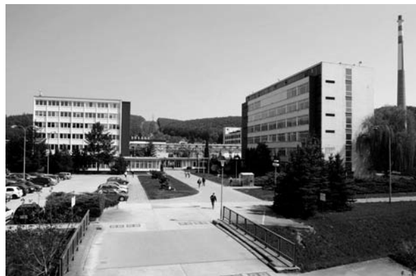
Obr. 5. Administrativní budova a Výzkumný ústav před likvidací firmy 9 )

násobku průměrné měsíční mzdy dle délky zaměstnání ve firmě 32 ). Drobní akcionáři, převážně z řad bývalých zaměstnanců, pak prodali své akcie většinovému vlastníkovi. Hospodaření Lachemy v roce 2008 skončilo historicky nejvyšší a poslední ztrátou ve výši 405 milionů 33 ) (graf 1).